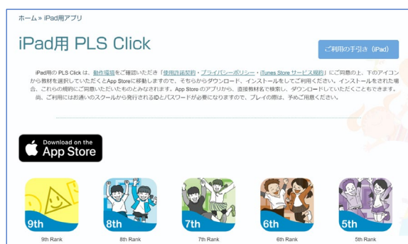
(例: iPad用アプリのページ)